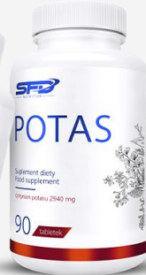
SFD POTAS 90 TAB.