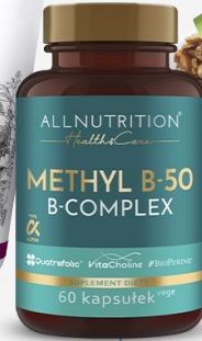
ALLNUTRITION HEALTH&CARE METHYL B-50 FORTE (SUPER B-COMPLEX 50 MAX Methyl + TMG)