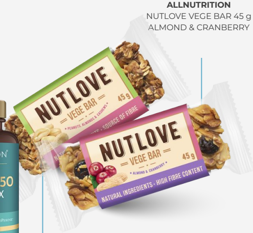
ALLNUTRITION NUTLOVE VEGE BAR 45 g ALMOND & CRANBERRY