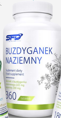
SFD BUZDYGANEK naziemny 360 tab.