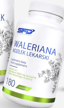
SFD WALERIANA KOZLEK LEKARSKI 180 tab.