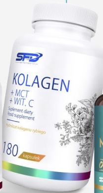
SFD KOLAGEN +MCT +WIT. C. 180 caps.