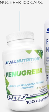
ALLNUTRITION FENUGREEK 100 CAPS.