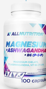
innowacja ALLNUTRITION Magnesium +Ashwagandha +B6