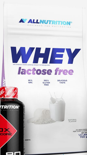
ALLNUTRITION Whey Lactose Free Natural