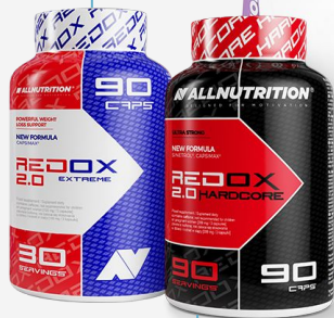
ALLNUTRITION Redox HARDCORE 2.0