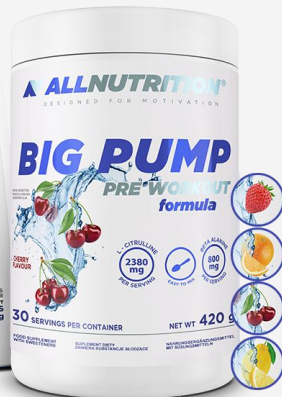
ALLNUTRITION Big Pump - 4 smaki