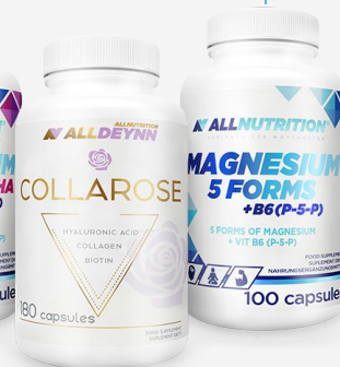
innowacja ALLNUTRITION Magnesium 5 FORMS