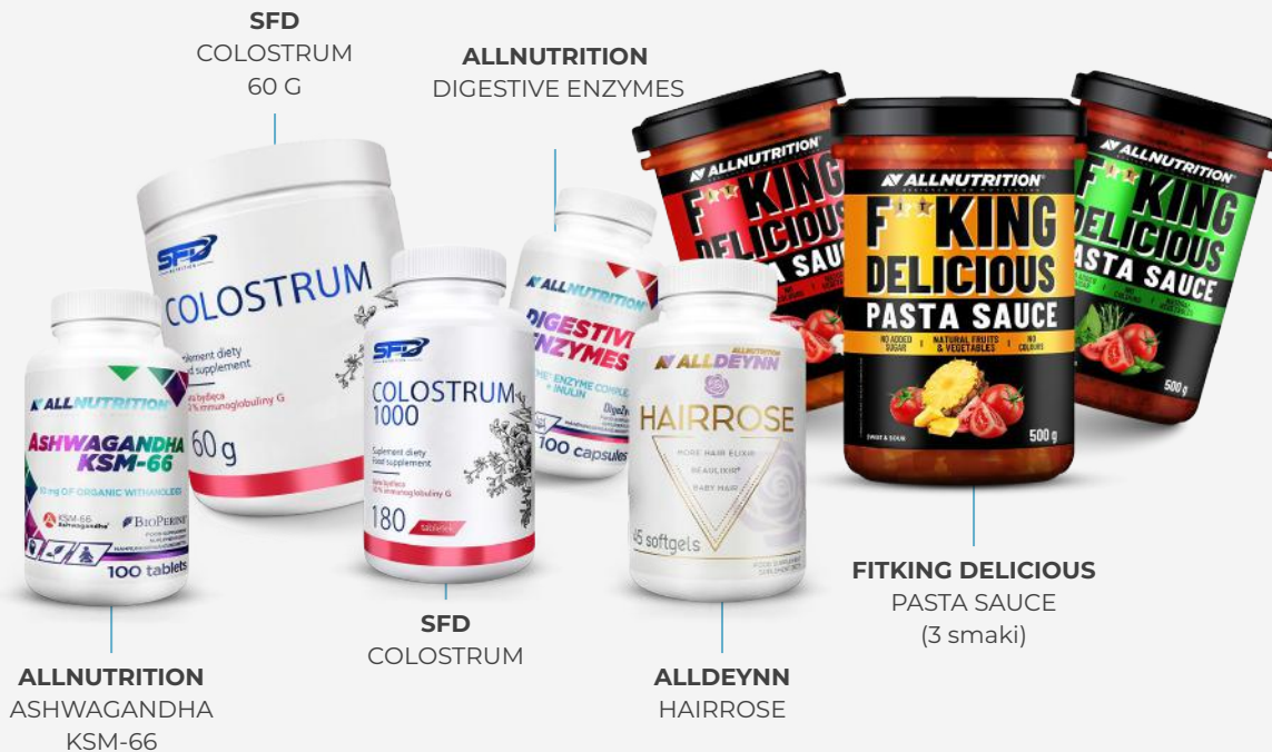
SFD COLOSTRUM 60 G