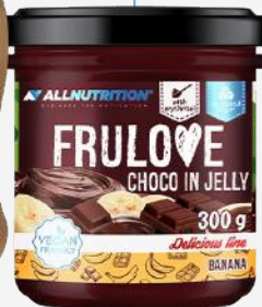
FRULOVE Choco in Jelly Banana