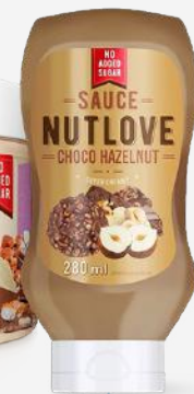
NUTLOVE Sauce Choco Hazelnut