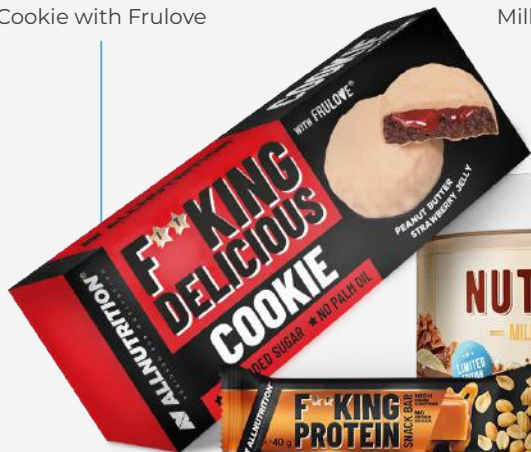
NUTLOVE Milky Crispies