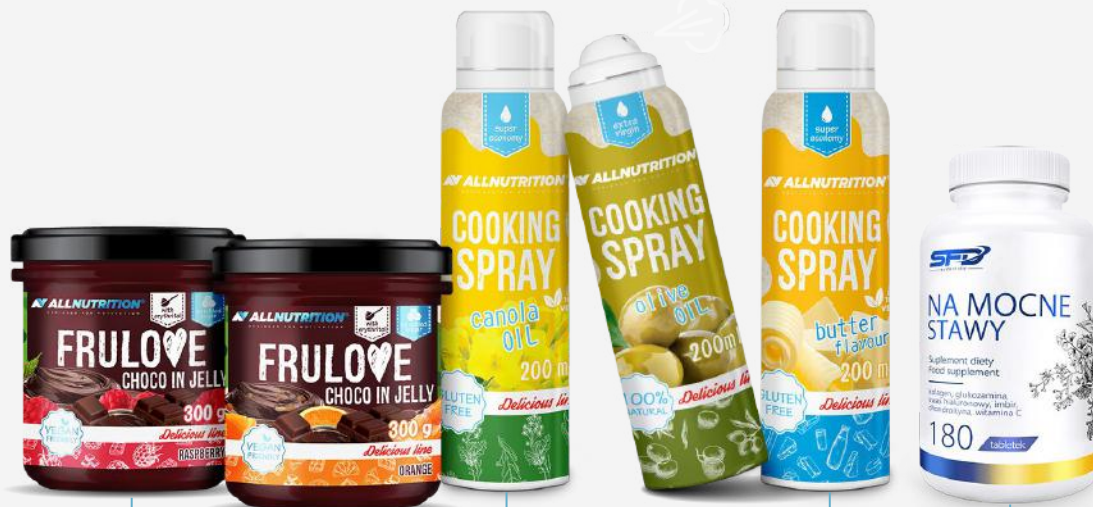
FRU LOVE CHOCO IN JELLY Orange & Raspberry