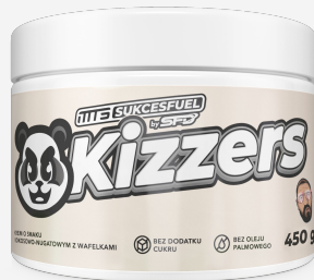
SFD Kizzers krem