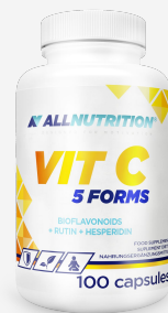
ALLNUTRITION VIT C 5 Forms