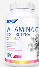
SFD WITAMINA C