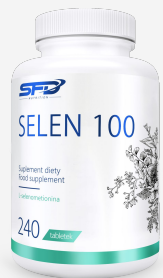
SFD Selen 100