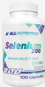
ALLNUTRITION Selenium 200